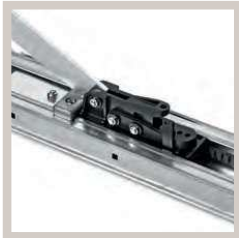
Snel een eenvoudig te gebruiken ontgrendelingsysteem