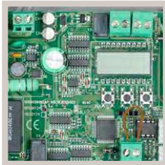
Inclusief motorsturing en ontvanger