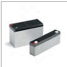
2,1Ah 12 Vdc batterij