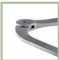
Knikarm gemaakt van behandeld aluminium