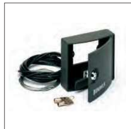
Extern te monteren anti-inbraak ontgrendelingsmechanisme Voor het ontgrendelen van de poort van buitenaf

BN.SE 9090019 BA 9099053 BN.BS 9099002 BN.CB 9760072 BN.24V 9760073 DA.BT6 F8086020 DA.BT2 F8086010