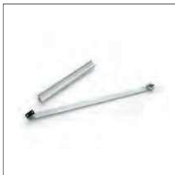
Schuifarm voor BEN