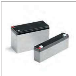
7Ah 12 Vdc batterij Moet worden geplaatst in een externe box