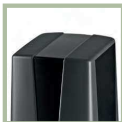
Eenvoudig compact design met de sterke kwaliteit van Beninca