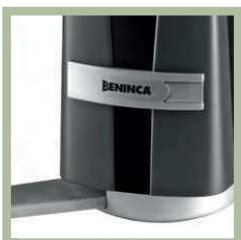
Ontgrendelingsmechanisme met sleutel