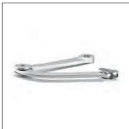
Knikarm voor BEN