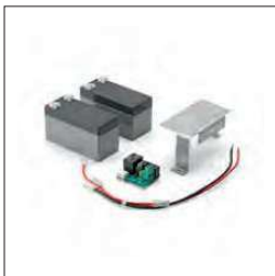
Accessoire voor CP.BEN bestaande uit een acculader kaart CBY.24V, 1,2 Ah batterijen en montagesteun voor de batterijen